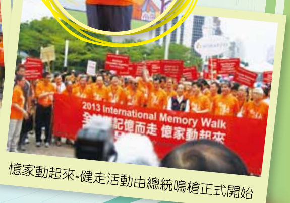
憶家動起來-健走活動由總統鳴槍正式開始