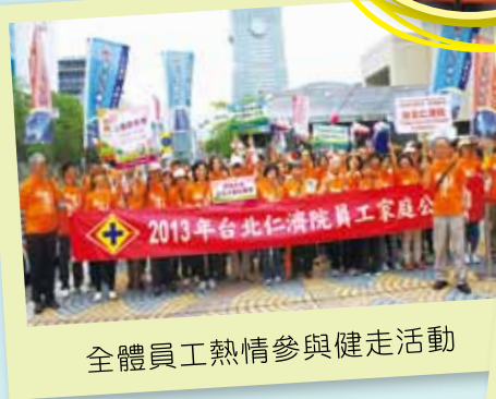
全體員工熱情參與健走活動